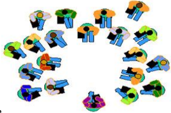
صورة توضح ترتيب الفصل في استراتيجية حوض السمك

يتم وضع 4 أو 5 كراسي في دائرة على شكل حوض سمك. توضع باقي الكراسي خارج حوض السمك، وبشكل دائري أيضا. يجلس عدد من الطلاب على كراسي حوض السمك لمناقشة موضوع ما أو إنجاز مهمة أو حل مشكل في مدة تقارب 10 دقائق، بينما يجلس الباقون (وهم الملاحظون) خارج الحوض يستمعون بتركيز و يسجلون الملاحظات.