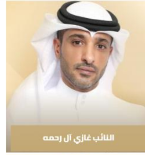
النائب غازي آل رجمه