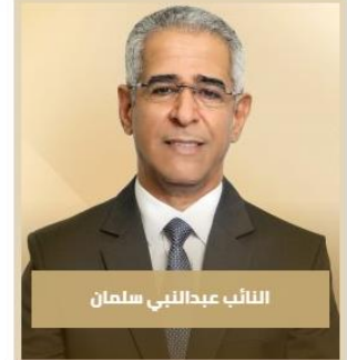
النائب عبداللتي سلمان