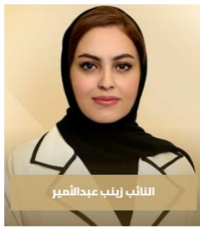
النائب زينب عبدالأمير