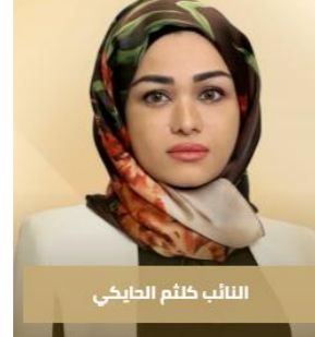
النائب كلثم الحارثي