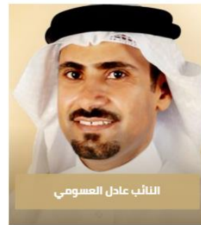
النائب عادل العسومي