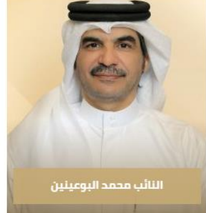
النائب محمد البوعيين