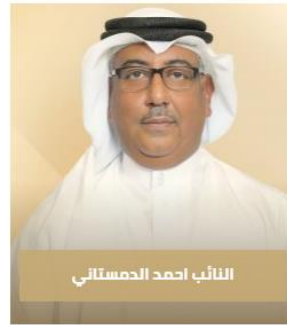
النائب احمد الحمستاني