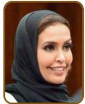
سعادة الدكتورة جهاد عبدالله الفاضل