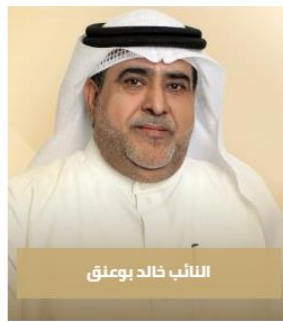
النائب خالد بوعنق