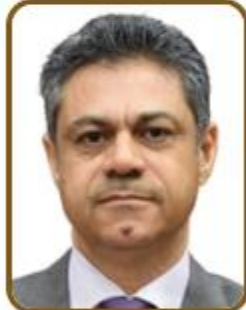
سعادة الدكتور محمد علي حسن علي