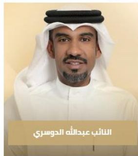
النائب عبدالله الحوسري