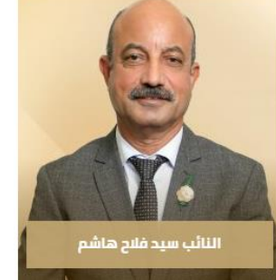
النائب سيد فلاح هاشم