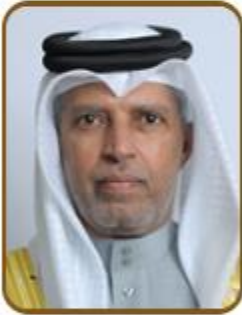
سعادة السيد فيصل راشد علي النعيمي