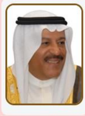
معالي السيد علي بن صالح الصالح