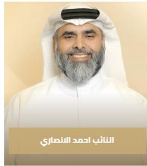
النائب احمد الانصاري