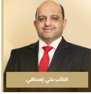
النائب علي إسحاقى