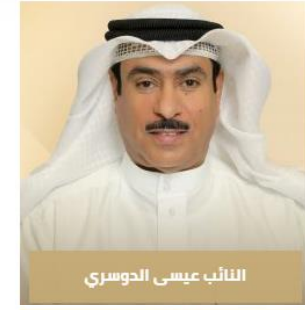
النائب عيسى الدوسري