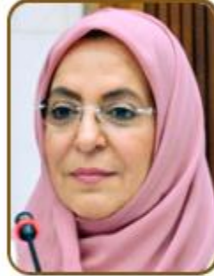
سعادة الدكتورة فاطمة عبدالجبار الكوهجي