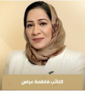
النائب فاطمة عباس