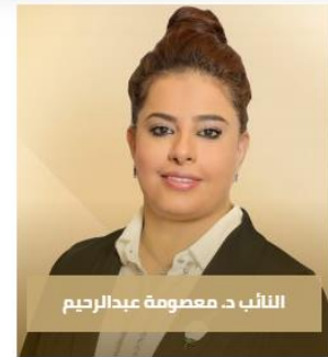
النائب د. معصومة عبدالرحيم