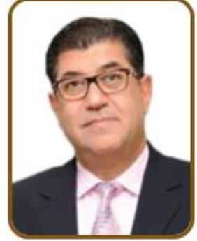
سعادة السيد جمال محمد فخرو