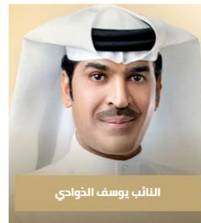
النائب يوسف الخواصي