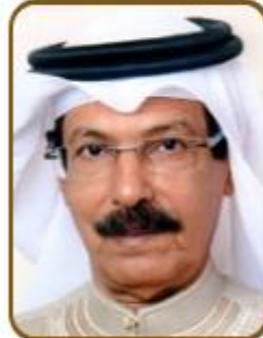
سعادة الدكتور عبدالعزيز عبدالله العجمان