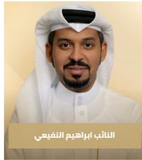
النائب ابراهيم النفيعي