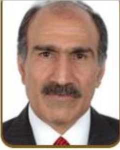
سعادة الدكتور عبدالعزيز حسن أبل