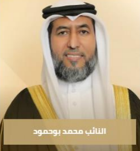
النائب محمد بوحمود