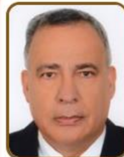
سعادة الدكتور أحمد سالم العريض