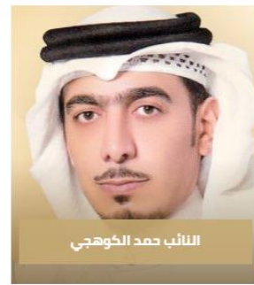
النائب حمد الكوهجي