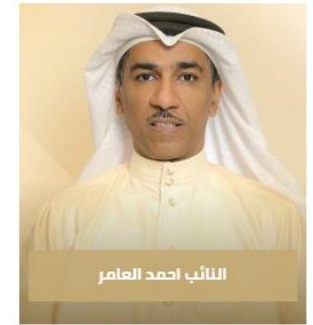
النائب احمد العامر