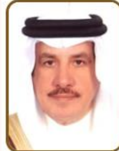
سعادة السيد حمد مبارك النعيمي