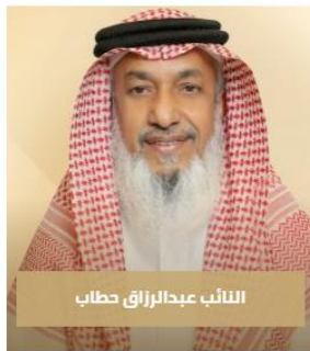
النائب عبدالرزاق خطاب