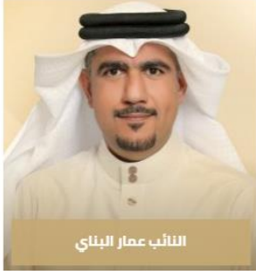
النائب عمار البناي