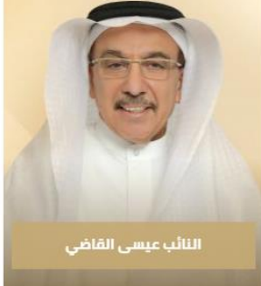
النائب عيسى القاضي