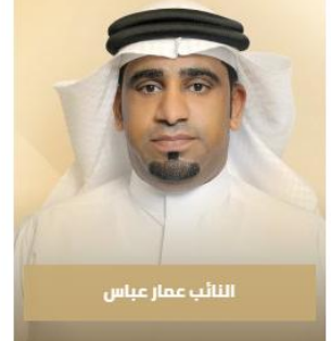
النائب عمار عباس