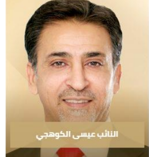
النائب عيسى الخوهجي